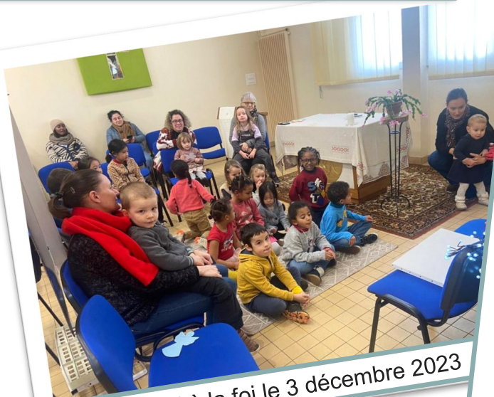
Éveil à la foi le 3 décembre 2023