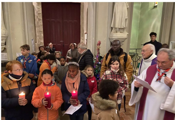
Messe des familles le 17 décembre 2023