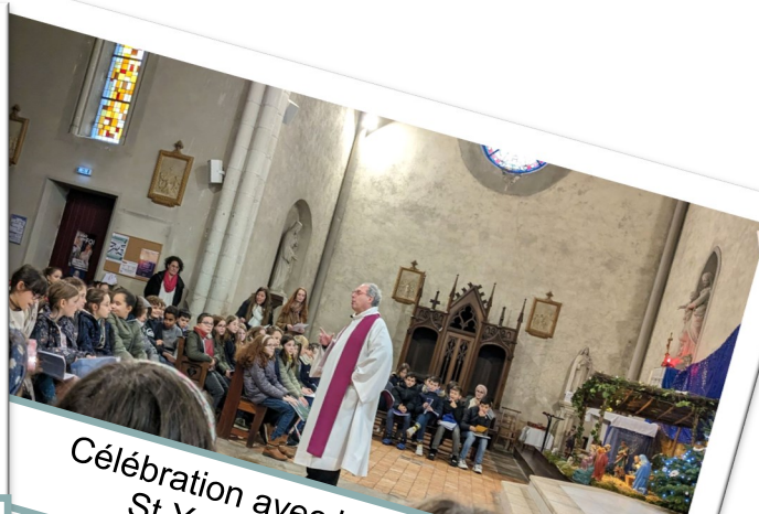
Célébration avec les enfants de l'école St Yves le 21 décembre 2023