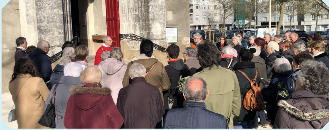
Samedi 1 er avril : fête des Rameaux à Saint-Joseph