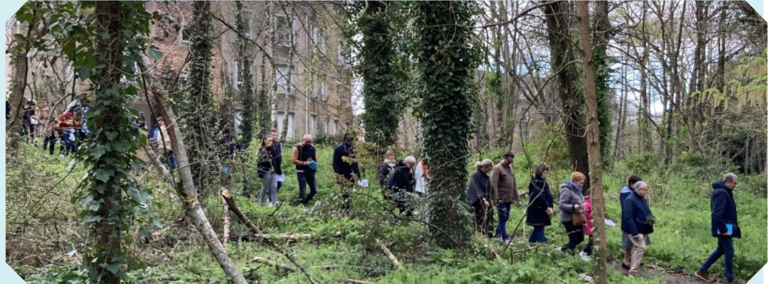
un pèlerinage entre Saint-Georges et Saint-Joseph centré sur le récit de la Passion